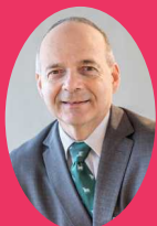
DOMINIQUE MOCKLY PRÉSIDENT DU FONDS DE DOTATION TERÉGA ACCÉLÉRATEUR D'ÉNERGIES