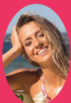
MAUD LE CAR S'AVE LA MERMAID