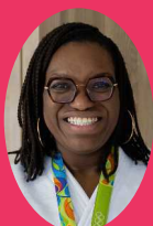
ÉMILIE ANDÉOL FONDATION IPPON